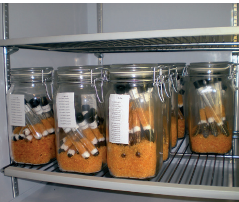
Cámaras de conservación