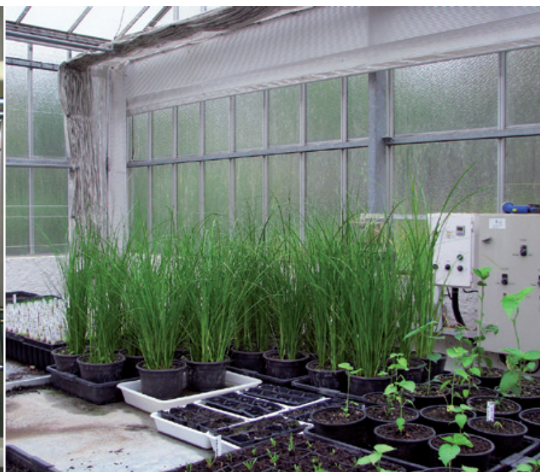
Cultivo de Cladium mariscus y de Hibiscus palustris