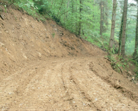
Figura 3: Ejecución de pista de 1.º orden con gestión mancomunada

con ímpetu en aras de conseguirlo. Esta pieza clave, que es la necesidad, va a actuar de fuerza motriz para iniciar un proyecto cuyo objetivo principal es la construcción y gestión de una pista forestal y que no tiene por qué ser el único, ya que puede ser un primer paso hacia una gestión mancomunada de los recursos del área establecida.