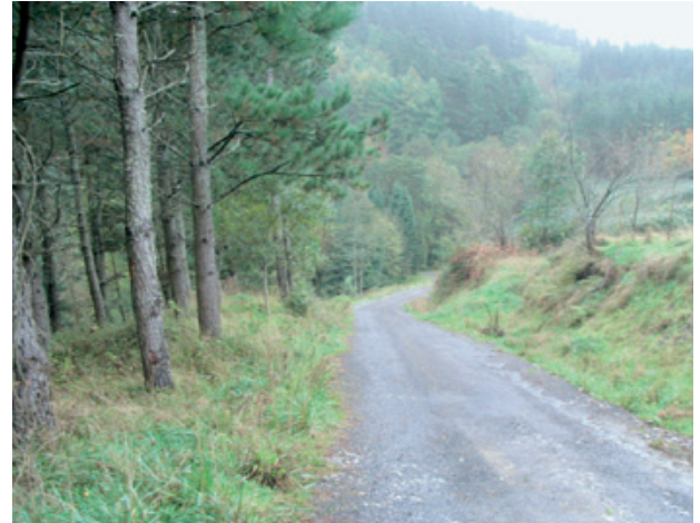
Pista Forestal de 1.ª orden gestionada por la Agrupación de Propietarios

Esta realidad implica que para llegar a conseguir una superficie de bosque de más de 100.000 ha se haya tenido que cuajar entre los propietarios privados de los montes una cultura forestal muy importante. Mucha culpa de esto la tiene el asociacionismo, liderado por las Asociaciones de Propietarios Forestales, que han sido embajadoras de la cultura forestal entre los propietarios de montes privados.