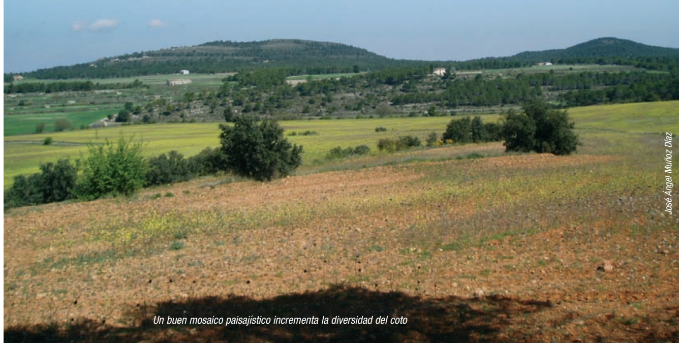
Un buen mosaico paisajístico incrementa la diversidad del coto

La titularidad cinegética, que genera la renta cinegética, impone también una serie de gastos como licencias, impuestos, entablillado, Plan Técnico..., así como la obligación de asumir determinados imprevisibles e imprevistos. Todo ello debe plasmarse en unos fondos racionales y proporcionados.