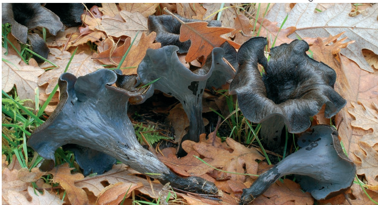
Craterellus cornucopioides (Lin.: Fr.) Pers.